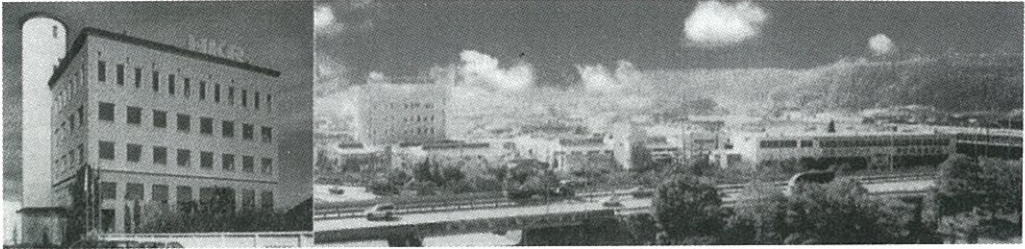
本社ビル（左）と本社工場全景（右）