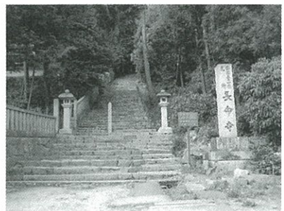
長命寺の長く傾斜がきつい808の石段

市内より少し離れていますが、琵琶湖の畔に西国三十一番札所の長命寺があります。開基は聖徳太子とされ、今の寺は1521年～1614年にかけて再建されたものといわれています。ご利益は、その名の通り健康長寿、無病息災で、ふもとから山門まで続く石段は808段あり、きつい傾斜でかなりハードな歩きを覚悟する必要があります。もっとも、車で山門まで通じる道路があり、体力に自信がなければこちらを利用できます。境内からは琵琶湖を眺めることができ、本堂、本尊、三重塔などの重要文化財が現存しています。