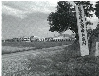
住連坊・安楽坊の墓より工場正面を望む

工場周辺にも歴史を感じさせるものが数多くあります。その一端を紹介すると、町名では千僧供町、馬淵町、長福寺町などその歴史を紐解くとその由来がわかります。また、史跡では供養塚古墳など数多くの古墳群（弥生時代～）、古墳の上に作られた住連坊・安楽坊の墓（江戸時代）、瓶割山城址（戦国時代）、などが点在して