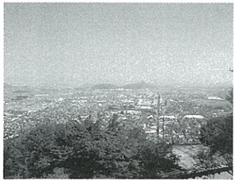
八幡山より近江八幡市街を望む