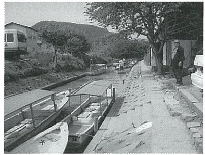
水郷めぐりの船着場

「世界一遅い乗り物」をキャッチフレーズに西の湖の水郷地帯を伝馬船で巡る観光は、葦（ヨシ）の群生やカイツブリなどのさまざまな野鳥が見られ、一見の価値あります。舟を漕ぐ船頭さんは平均年齢が70歳を超えていますが、そのぶん話のやりとりがなかなか面白く楽しめます。