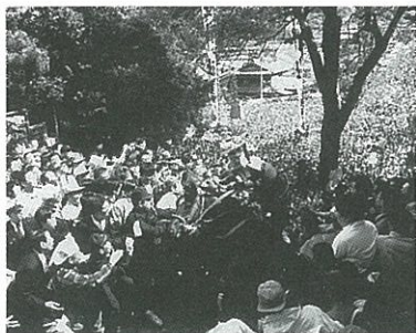
多度・上げ馬神事